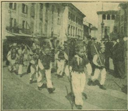
Le pittoresche tradizioni della Pasqua